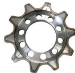
Secteur denté monochaîne au pas de 124 et 150